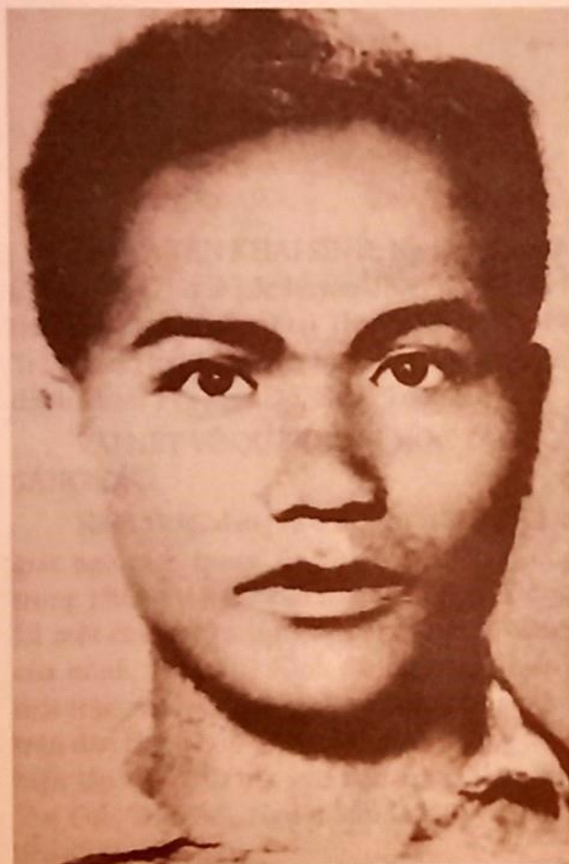
Nhà thơ TRẦN MAI NINH (1917 - 1947)